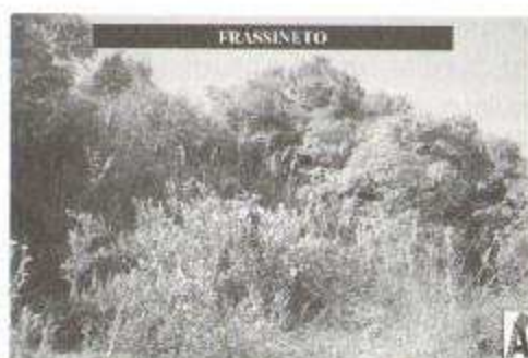
Fig. 20: Frassineto sulla collina di Alta Iola a mezzogiorno di Croci e Chiesanuova