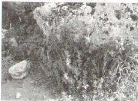
Fig. 7: Paritaria tra i ruderi di Selinunte

L'esempio primo, e a cui accenneremo soltanto, è rappresentato dalla Paritaria , pianta della famiglia delle Ortiche , detta in siciliano " erba di vento ", che cresce soprattutto dove l'uomo ha più utilizzato la pietra ai fini edilizi: i centri storici delle città come Palermo e Trapani sono l'habitat ideale per lo sviluppo della pianta; meno presente nelle zone di nuova urbanizzazione dove prevalgono cemento e asfalto; rara è invece la presenza in aperta campagna, tranne che in prossimità di bagli o muretti a secco. Ricordo che la Paritaria libera il polline per tutta la Primavera e l'inizio dell'Estate, ed anche in Autunno. Produce tantissimi granuli, anche 2.000 per metrocubo d'aria, molto piccoli, che giungono in profondità nelle vie aeree, essendo così causa, non solo di Congiuntivite e Rinite, ma anche di Asma.