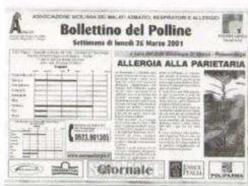
Fig. 26: il Bollettino del Polline stampato settimanalmente e affisso nelle Farmacie e negli studi medici

Ma per tutto ciò che abbiamo detto prima, questi dati vengono anche pubblicati in ambito locale su giornali, televisione, internet, mediante l'impegno dell'Ordine dei Medici e di Federfarma, allo scopo di raggiungere tutti gli interessati al problema. Infatti conoscere le caratteristiche locali rispetto ai calendari pollinici ufficiali è di grande