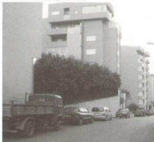
Fig. 14: Cipressi frangivento in via Avellino