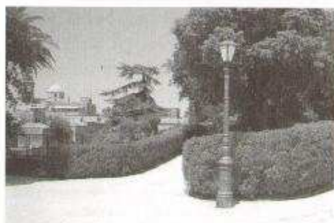
Fig. 21: Siepi di Ligustro ai Giardini del Balio di Erice