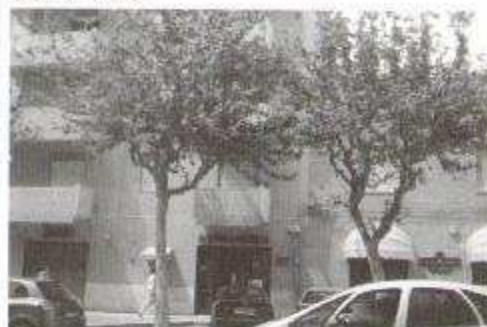
Fig. 23 e Fig. 24: I Platani di viale Piersanti Mattarella a Trapani

I dati del monitoraggio confluiscono nelle reti nazionali ed internazionali per scopi di ricerca scientifica e, rielaborati, ritornano ai cittadini sottoforma di calendari pollini pubblicati su tutte le testate nazionali, quotidiani, rotocalchi, televisioni.