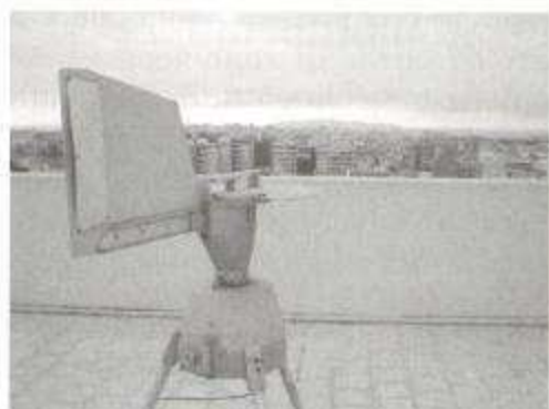
Fig. 3: Pollen Trap sulla città di Trapani