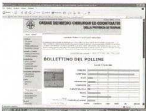
Fig. 25: il Bollettino del Polline di Trapani pubblicato on-line dall'Ordine dei Medici

I dati del monitoraggio confluiscono nelle reti nazionali ed internazionali per scopi di ricerca scientifica e, rielaborati, ritornano ai cittadini sottoforma di calendari pollini pubblicati su tutte le testate nazionali, quotidiani, rotocalchi, televisioni.