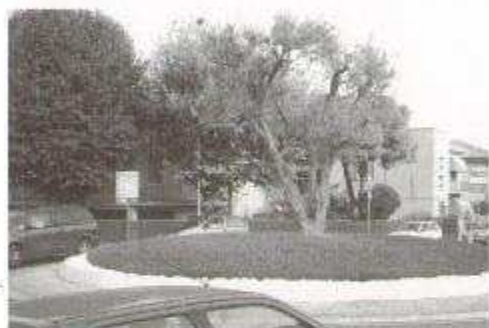
Fig. 17: Olivi ornamentali utilizzati come verde pubblico

Ruolo ancora maggiore ha avuto l’uomo nella diffusione dell’ Oli-vo , il principale albero fonte di allergia che per i noti motivi agricoli viene innestato, coltivato, potato per aumentarne la produzione del frutto, l’oliva: conseguenza ne è l’enorme aumento “innaturale” dei pollini in Primavera. A ciò si associa il nuovo problema dell’Oli-vo utilizzato come pianta ornamentale in città, nei giardini e comunque molto vicino alle abitazioni.