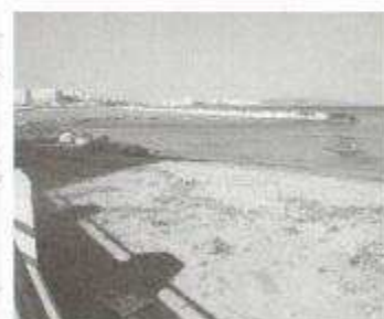
Fig. 12: Litorale Nord: frangiflutti, deposito di detriti e crescita di Chenopodiacee a due passi dai condomini

Ancora più alta è l'importanza allergologica emergente del Cipresso e delle altre piante della famiglia, Tuja , Criptomeria , Tasso e Ginepro , tutte utilizzate a scopo ornamentale. Queste piante, che impollinano già all'inizio della Primavera e continuano fino a Maggio, sovrapponendosi ai picchi della Paritaria, liberano enormi quantità di polline, più di tutte le altre (anche 3000 granuli per metrocubo d'aria)