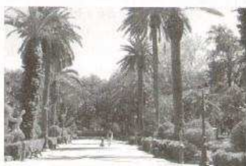
Fig. 22: Siepi di Ligustro alla Villa Margherita di Trapani

ce tantissimo polline, che, per fortuna dei soggetti allergici, non ha grande capacità di viaggiare nell'aria e diffondersi: i granuli pollinici infatti non raggiungono che qualche centinaio di metri, al massimo un chilometro, di distanza dalla fonte. Sono quindi gli alberi ideali da piantare in parchi e verde pubblico appena fuori città e quindi fruibili con facilità di accesso. Purtroppo a Trapani, pur esistendo pochissimi viali alberati, in uno di questi, la via Piersanti Mattarella, sono stati piantati come verde pubblico alberi di Platano, che diffondono l'abbondante pollini nelle camere da letto dei cittadini, fino al quarto piano, a due metri di distanza.