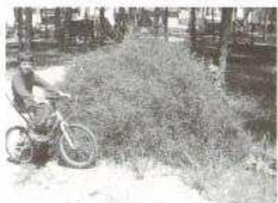
Fig. 10: Salsola sul litorale sabbioso adiacente una pinetina

Tutto ciò fa riflettere e conferma l'importanza dell'intervento umano sulle modifiche del territorio in cui vive e del relativo ecosistema.