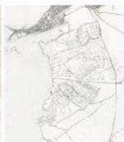
Fig. 11: L'estensione delle saline rispetto al centro urbano di Trapani