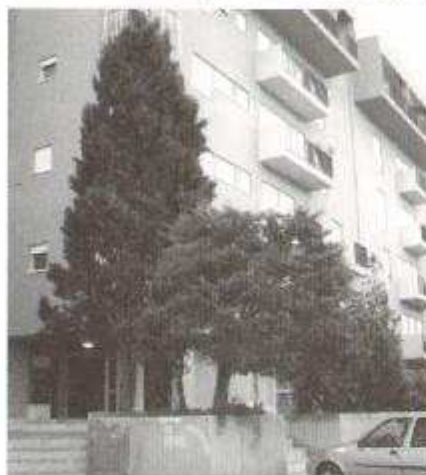
Fig. 13: Cipressi e Tuje in via Villa San Giovanni

te Erice; così per le note leggi antisismiche post terremoto del Belice ed il bassissimo indice di edificabilità, negli ultimi trenta anni sono state realizzate soltanto villette mono e bifamiliari e piccoli stabili con obbligo di ampie aree condominiali adibite a verde e parcheggio. Così il Cipresso è stata, e continua ad essere, la pianta utilizzata nel 90% dei casi a scopo ornamentale, ombroso o frangivento.