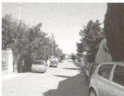
Fig. 15: Cipressi di ogni specie e foggia in via Dell'Ostello