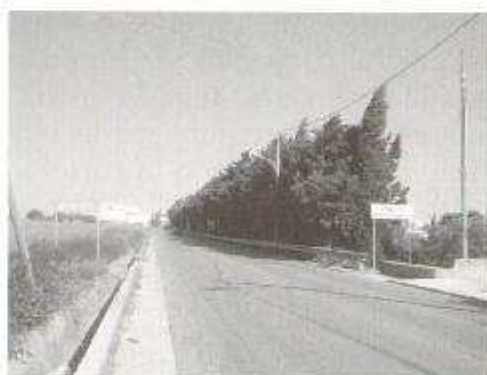
Fig. 16: Cipressi sulla Strada Statale di Bonagia

E' d'altro canto innegabile che alla presenza dei pollini in atmosfera deve corrispondere un reale riscontro dei soggetti allergici a quei pollini; a conforto di ciò è venuta incontro l'industria che ha prodotto estratti diagnostici di ultima generazione, soprattutto per le "famiglie