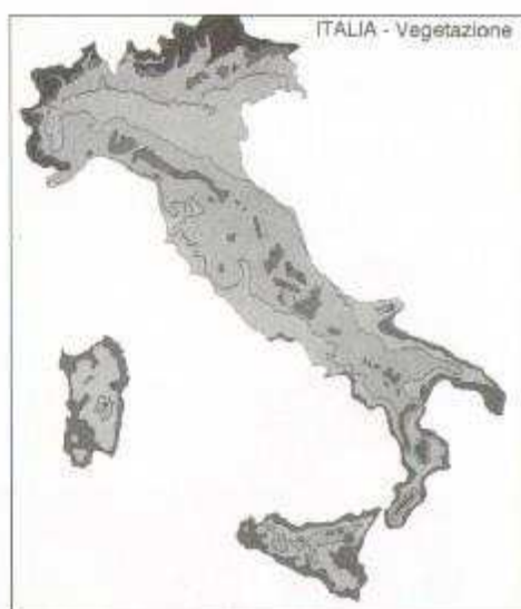
Fig. 2: mappa della vegetazione d'Italia

Pollen Trap è il nome della macchina utilizzata per la cattura dei pollini; è un campionario di tipo volumetrico, basato cioè, sull'aspirazione di un volume d'aria noto. E' dotato di un alettone che lo rivolge sempre al vento facendolo girare sul proprio asse. L'aria aspirata viene veicolata su un tamburo controllato da un sistema ad orologeria che compie una rotazione completa in una settimana. Sul tamburo viene distesa una striscia di plastica trasparente ricoperta di materiale adesivo adatto alla cattura dei pollini. Al termine della settimana di campionamento la striscia rimossa, viene tagliata, colorata con fucsina e montata su vetrini per l'osservazione al microscopio. Riconoscimento e conta dei pollini avvengono mediante la lettura parziale del vetrino e calcolo statistico basato sul volume (noto) di aria aspirata.