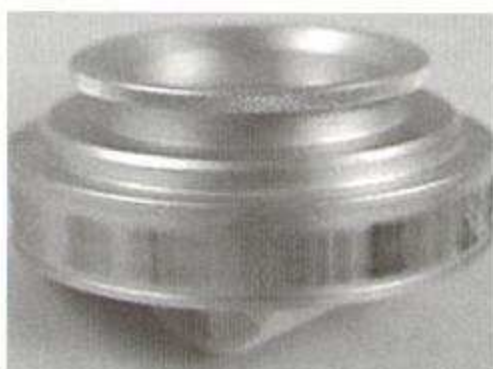
Fig. 4: tamburo e striscia di plastica su cui aderiscono i pollini