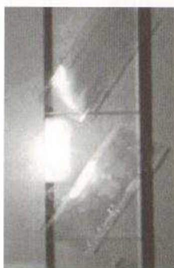
Fig 6: vetri colorati e pronti per la lettura