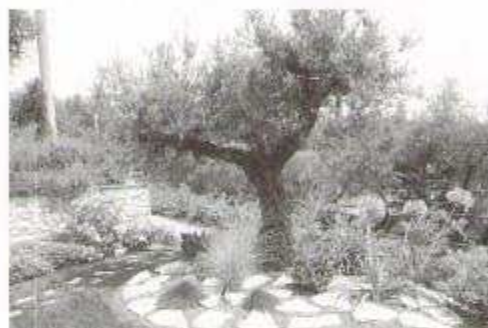
Fig. 18: Olivi ornamentali in giardino privato

Pollini simili diffonde nell’aria il Frassino , pianta oggi sconosciuta, che fino a qualche decennio fa i nostri contadini piantavano in cima alle collinette, dette “ timponi ”, dove si trovavano massi e pietre risultato dello spietramento dei terreni ed dove era difficile coltivare altre piante; incidendo la corteccia del Frassino con un apposito falcetto detto “ mamarolo ” si estraeva la “ manna ”, un lassativo di qualità che i nostri contadini vendevano ai farmacisti. Oggi il Frassino, nè coltivato nè estirpato, cresce rigoglioso in forma arbustive e diffonde tantissimo polline.