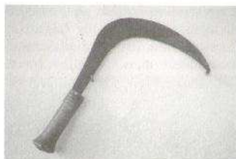
Fig. 19: Mannarolo