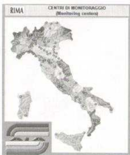
Fig. 5: Rete Italiana di Monitoraggio Aerobiologico