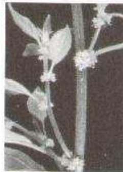
Fig. 8: rametto di Paritaria