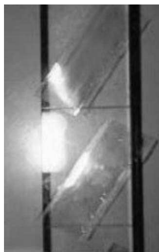
Fig 6: vetrini colorati e pronti per la lettura