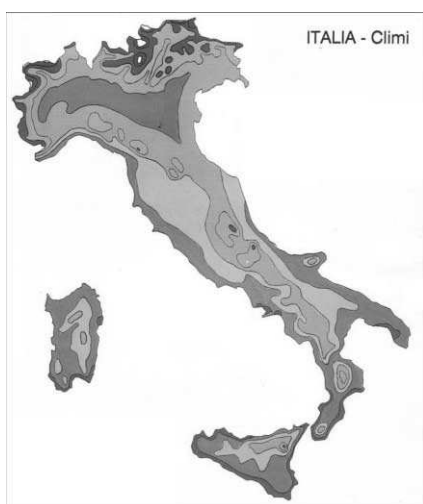
Fig 1: mappa dei climi d'Italia

Per tale motivo, all'interno delle reti di monitoraggio pollinico, le singole stazioni assumono una enorme importanza scientifica ed epidemiologica poiché rilevano e fotografano una precisa realtà allergologica spesso notevolmente differente da quella di zone geografiche vicine. Così per esempio, all'interno della macro-area Sud, il Salento ha molte caratteristiche aerobiologiche comuni con la Sicilia occidentale; di contro molto differenti da questi sono i dati pollinici delle aree appenniniche di Campania e Calabria simili invece a quelli delle zone di Messina e di Catania in cui la flora arborea montana è ampiamente rappresentata.