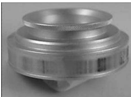
Fig 4: tamburo e striscia di plastica su cui aderiscono i pollini