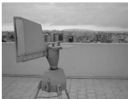
Fig 3: Pollen Trap sulla città di Trapani

viene veicolata su un tamburo controllato da un sistema ad orologeria che compie una rotazione completa in una settimana. Sul tamburo viene distesa una striscia di plastica trasparente ricoperta di materiale adesivo adatto alla cattura dei pollini. Al termine della settimana di campionamento la striscia rimossa, viene tagliata, colorata con fucsina e montata su vetrini per l'osservazione al microscopio. Riconoscimento e conta dei pollini avvengono mediante la lettura parziale del vetrino e calcolo statistico basato sul volume (noto) di aria aspirata.