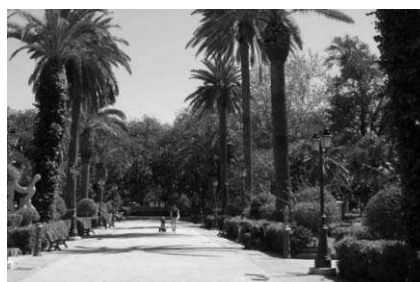
fig.22: alla Villa Margherita di Trapani