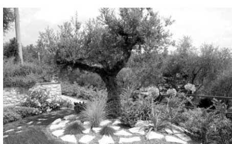
Fig.18: Olivi ornamentali in giardino privato

Pollini simili diffonde nell'aria il Frassino, pianta oggi sconosciuta, che fino a qualche decennio fa i nostri contadini piantavano in cima alle collinette, dette "timponi", dove si trovavano massi e pietre risultato dello spietramento dei terreni ed dove era difficile coltivare altre piante;