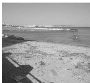
Fig12: Litorale Nord: frangiflutti, deposito di detriti e crescita di Chenopodiacee a due passi dai condomini