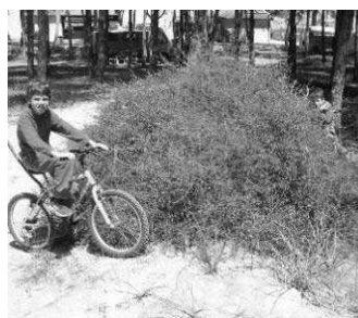
Fig10: Salsola sul litorale sabbioso adiacente una pinetina

Per di più, negli ultimi anni, si è fatta sempre più frequente la presenza di queste piante in luoghi dove non erano mai cresciute in precedenza, quali per esempio zone secche e cumuli di detriti formati