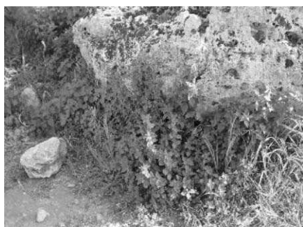
Fig 7: Parietaria tra i ruderi di Selinunte

L'esempio primo, e a cui accenneremo soltanto, è rappresentato dalla Parietaria, pianta della famiglia delle Ortiche, detta in siciliano " erba di vento ", che cresce soprattutto dove l'uomo ha più utilizzato la pietra ai fini edilizi: i centri storici delle città come Palermo e Trapani sono l'habitat ideale per lo sviluppo della pianta; meno presente nelle zone di nuova urbanizzazione dove prevalgono cemento e asfalto; rara è invece la presenza in aperta campagna, tranne che in prossimità di bagli o