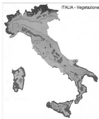
Fig 2: mappa della vegetazione d'Italia

Pollen Trap è il nome della macchina utilizzata per la cattura dei pollini; è un campionatore di tipo volumetrico, basato cioè, sull'aspirazione di un volume d'aria noto. E' dotato di un alettone che lo rivolge sempre al vento facendolo girare sul proprio asse. L'aria aspirata