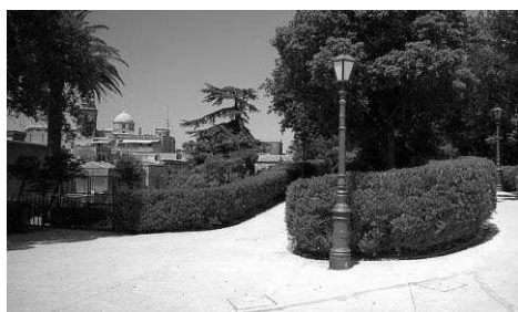
fig.21: ai Giardini del Balio di Erice

incidendo la corteccia del Frassino con un apposito falcetto detto "mannarolo" si estraeva la "manna", un lassativo di qualità che i nostri contadini vendevano ai farmacisti. Oggi il Frassino, nè coltivato nè estirpato, cresce rigoglioso in forma arbustive e diffonde tantissimo polline..