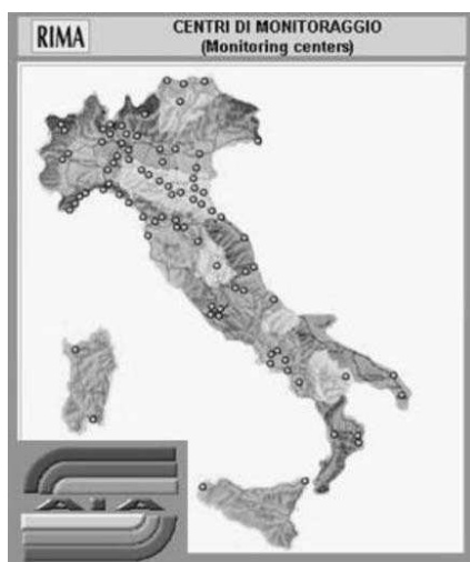
Fig 5: Rete Italiana di Monitoraggio Aerobiologico