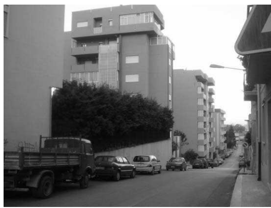
Fig14: Cipressi frangivento in via Avellino

E' d'altro canto innegabile che alla presenza dei pollini in atmosfera deve corrispondere un reale riscontro dei soggetti allergici a quei pollini; a conforto di ciò è venuta incontro l'industria che ha prodotto estratti diagnostici di ultima generazione, soprattutto per le "famiglie