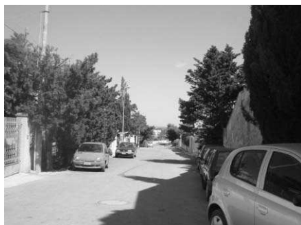
Fig15: Cipressi di ogni specie e foggia in via Dell'Ostello