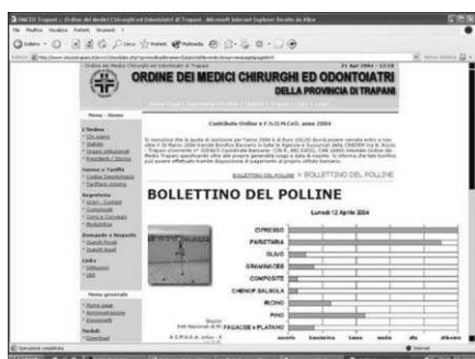
Fig. 25: il Bollettino del Polline di Trapani pubblicato on-line dall'Ordine dei Medici

I dati del monitoraggio confluiscono nelle reti nazionali ed internazionali per scopi di ricerca scientifica e, rielaborati, ritornano ai cittadini sottoforma di calendari pollini pubblicati su tutte le testate nazionali, quotidiani, rotocalchi, televisioni.