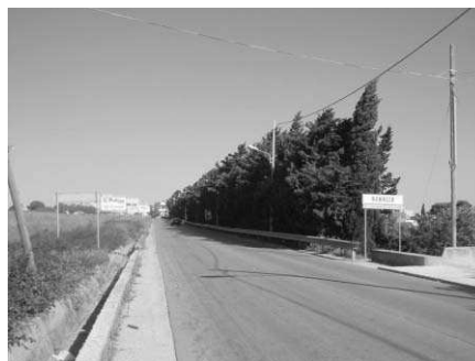
Fig16: Cipressi sulla Strada Statale di Bonagia

emergenti" come Chenopodiacee e Cupressacee, e così facilitato la diagnosi con l'individuazione di positività cutanee e confermato il reale aumento di queste pollinosi.