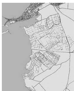
Fig11: l'estensione delle saline rispetto al centro urbano di Trapani