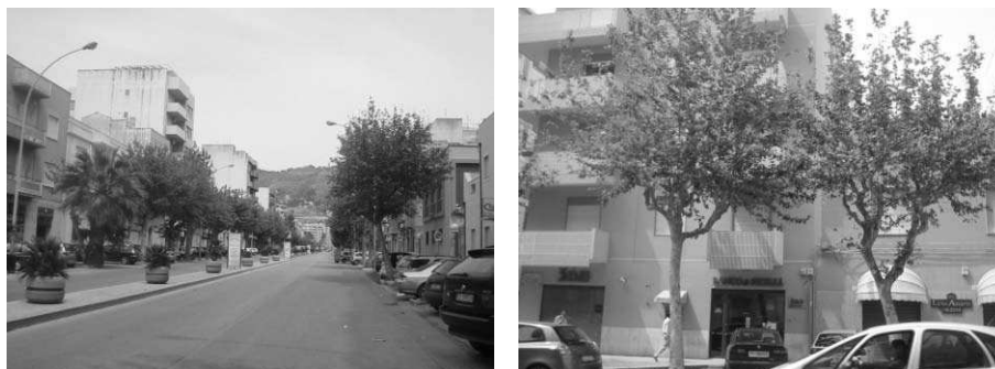
Fig.23 e fig.24: I Platani di viale Piersanti Mattarella a Trapani

studiato; con il sostegno di studi scientifici ed il supporto di ricercatori e studiosi dell'arte medica siamo adesso arrivati ad un punto di certezza che ci da il giusto sostegno per proporci alla comunità scientifica e culturale locale e nazionale.