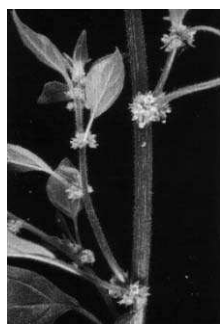
Fig 8: rametto di Parietaria