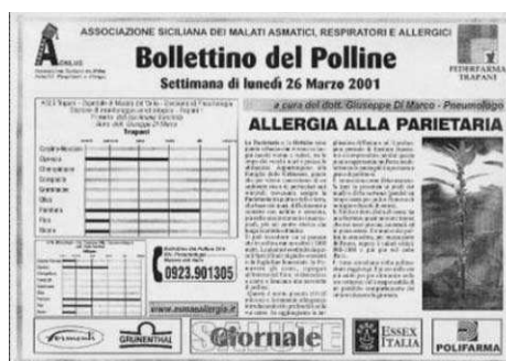
Fig.26: il Bollettino del Polline stampato settimanalmente e affisso nelle Farmacie e negli studi medici

Ma per tutto ciò che abbiamo detto prima, questi dati vengono anche pubblicati in ambito locale su giornali, televisione, internet, mediante l'impegno dell'Ordine dei Medici e di Federfarma, allo scopo di raggiungere tutti gli interessati al problema. Infatti conoscere le caratteristiche locali rispetto ai calendari pollinici ufficiali è di grande