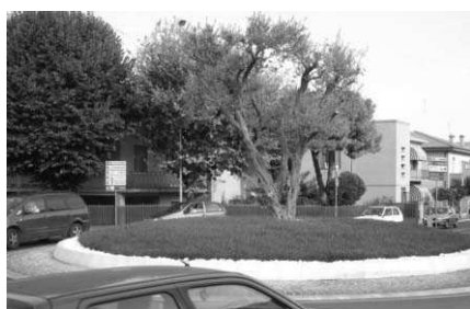
Fig.17: Olivi ornamentali utilizzati come verde pubblico

Ruolo ancora maggiore ha avuto l'uomo nella diffusione dell'Olivio, il principale albero fonte di allergia che per i noti motivi agricoli viene innestato, coltivato, potato per aumentarne la produzione del frutto, l'oliva: conseguenza ne è l'enorme aumento "innaturale" dei pollini in Primavera. A ciò si associa il nuovo problema dell'Olivio utilizzato come pianta ornamentale in città, nei giardini e comunque molto vicino alle abitazioni