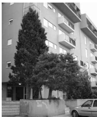
Fig13: Cipressi e Tuje in via Villa San Giovanni

In una città come Trapani, da tre lati bagnata dal mare, lo sviluppo urbanistico ha riguardato soprattutto la zona alle pendici del Monte Erice; così per le note leggi antisismiche post terremoto del Belice ed il bassissimo indice di edificabilità, negli ultimi trenta anni sono state realizzate soltanto villette mono e bifamiliari e piccoli stabili con obbligo di ampie aree condominiali adibite a verde e parcheggio. Così il Cipresso è stata, e continua ad essere, la pianta utilizzata nel 90% dei casi a scopo ornamentale, ombroso o frangivento.